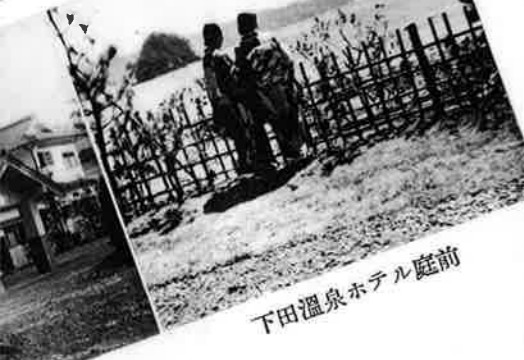
下田温泉ホテル庭前

下田温泉ホテルは 今井荘の姉妹館で 御座います。新築早々で最 新設備を有し下田灣の絶景 を一陣にする武ヶ濱のほとり 松林の中にあつて浴室は大小 八ヶ所湯量頗る豊富、滾々たる温 泉をたぐへた湯の面には松影横た はつて海を映し島を呼ぶ。一浴して 都塵洗はれ秘境の感を溜めます。庭前 の海邊は海水浴に適し、附近には名勝 史蹟多く又下田灣の内外は豊富な漁場 で沖子元島の養魚場と釣り場とを有し