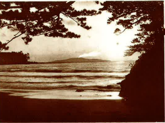
今井ノ濱日の出と大島