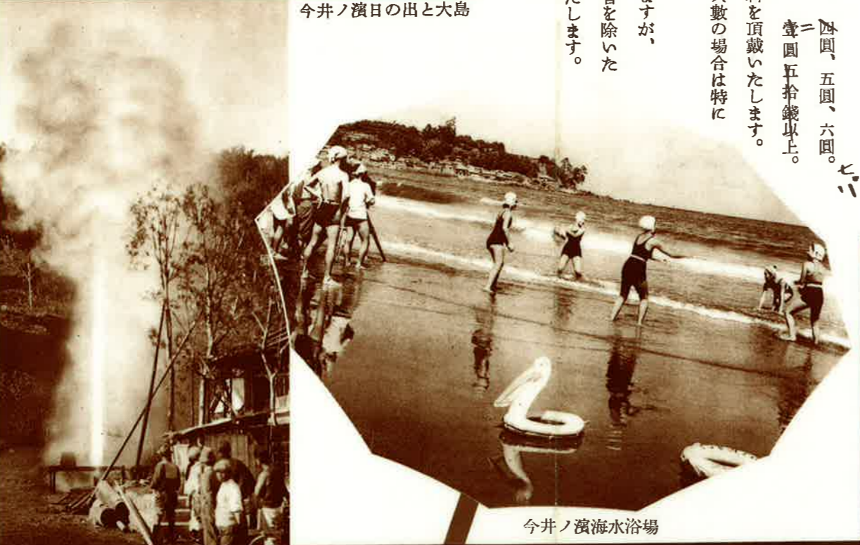
今井ノ濱海水浴場