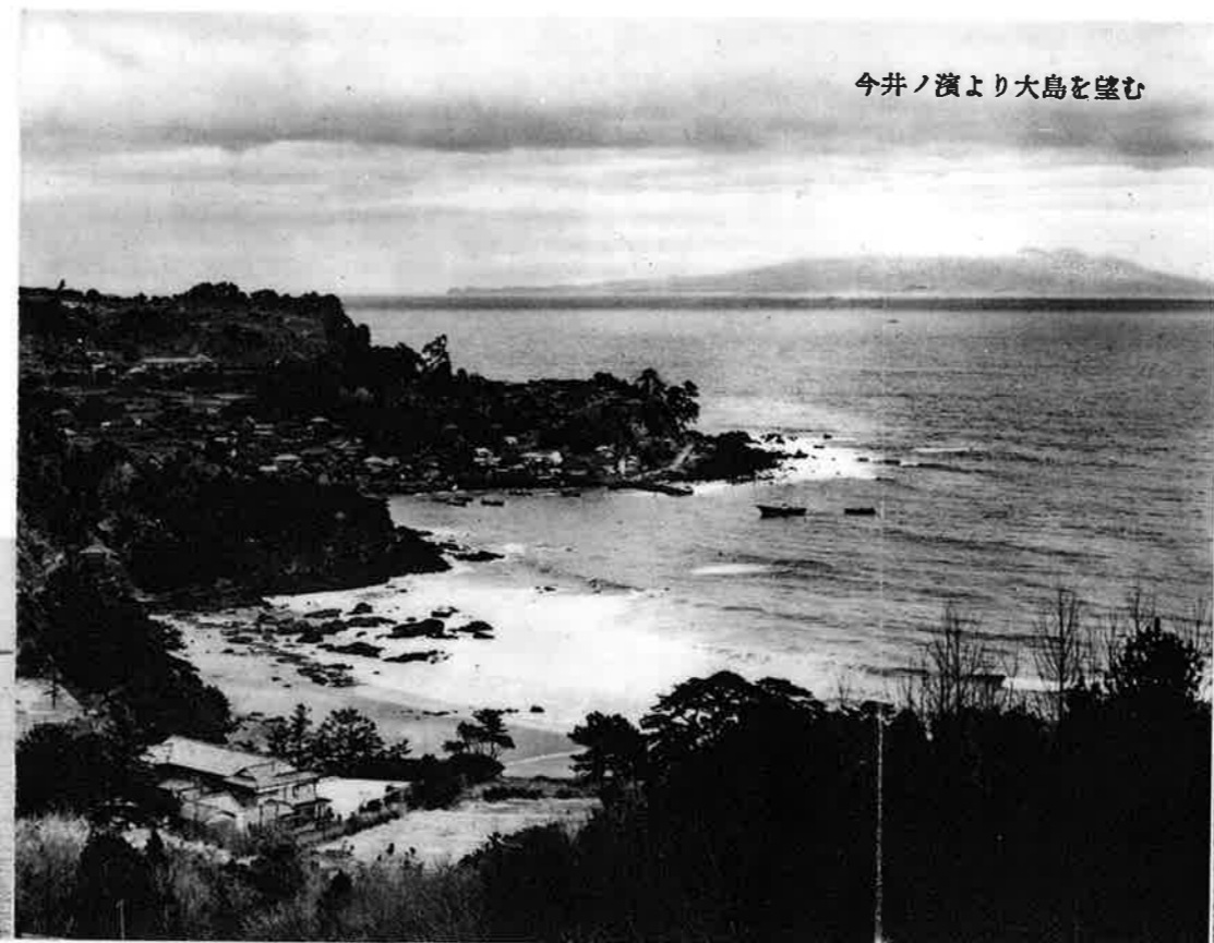
今井ノ濱より大島を望む

伊豆・今井ノ濱温泉 紺碧の滙しない大海原に突出する伊豆半島は氣候概ね溫和、人情素朴、山海の幸に恵まれた常春の里であり又到る所天與の温泉滾々として溢れ、山水溪谷の美を伴ふ一大樂園であります。 今井ノ濱 はこの東海岸伊東温泉と下田温泉との中間にある新興温泉地で、天城連山を背に東南に展げて海に臨み、冬暖かに夏涼しく、青松白砂伊豆舞子濱とも呼ばれて居ります。春は颯々たる緑風に汐干狩、夏は白汀長き所絶好の海水浴場、秋は紅葉に魚釣、冬の最中に菜の花が咲き莢莢豆が實り紅の椿が妍を競ひ黄金色の蜜柑が輝いてをります。四季とりんりの風情に富むいで湯の里、そこに唯一の温泉旅館、今井荘がひそやかに皆様をお待ち致して居ります。