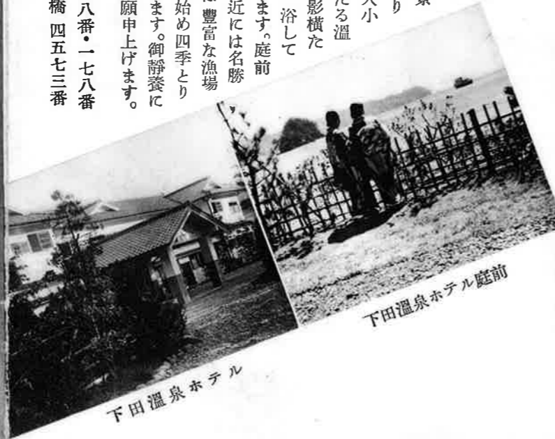
下田温泉ホテル庭前