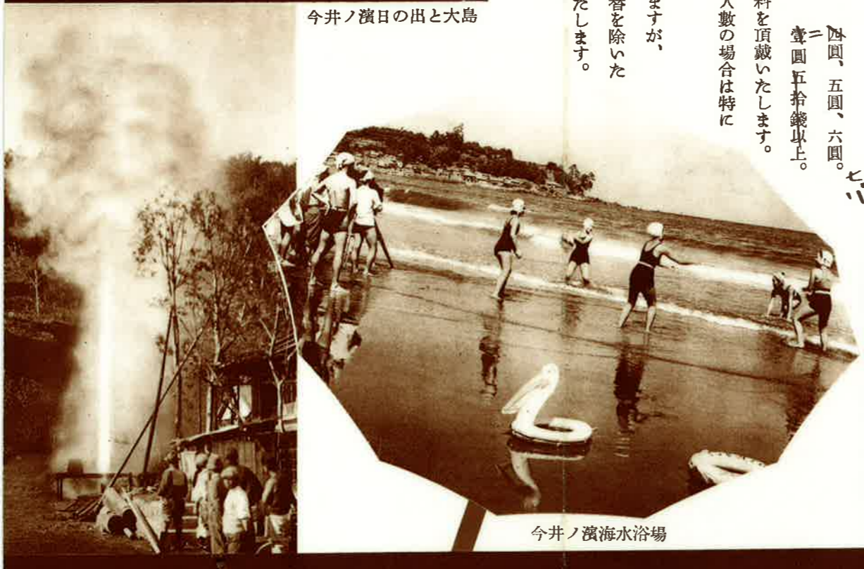
今井ノ濱海水浴場