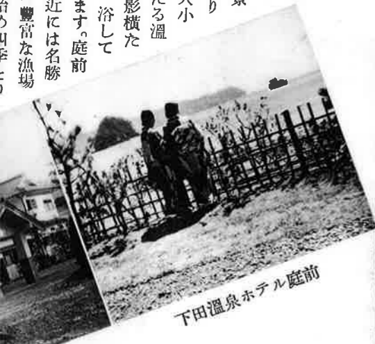
下田温泉ホテル庭前

御座います。新築早々で最新設備を有し下田灣の絶景を一陣にする武ヶ濱のほとり松林の中にあつて浴室は大小八ヶ所湯量頗る豊富、滾々たる温泉をたぐへた湯の面には松影横たはつて海を映し島を呼ぶ。一浴して都塵洗はれ秘境の感を溜めます。庭前の海邊は海水浴に適し、附近には名勝史蹟多く又下田灣の内外は豊富な漁場で沖子元島の養魚場と釣り場とを有し、