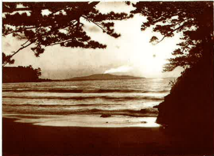
今井ノ濱日の出と大島